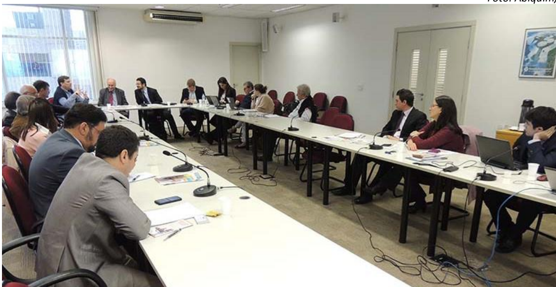
O secretário de Mudança do Clima e Florestas do Ministério do Meio Ambiente (MMA), Thiago de Araújo Mendes,