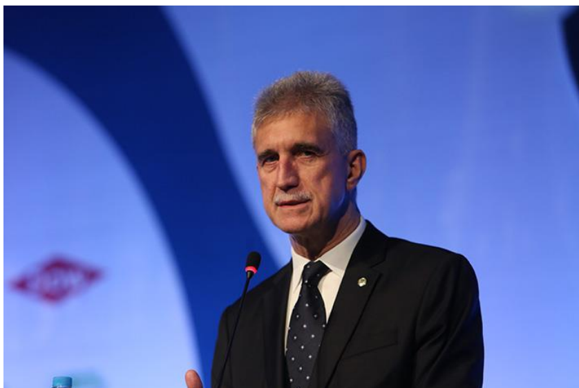
O deputado Milton Monti (PR/SP), coordenador temático de Infraestrutura e Logística da FPQuímica, no Encontro Anual da Indústria Química (ENAIQ) de 2017

O tema também contou com importante participação do deputado Milton Monti (PR/SP), coordenador de infraestrutura e logística da FPQuímica, que além de assumir a vice-presidência da Comissão Especial criada no Congresso Nacional para tratar da matéria, foi também autor do projeto de lei de nº 4060, de 2012, que deu origem à discussão e que indexou o trabalho da Comissão.