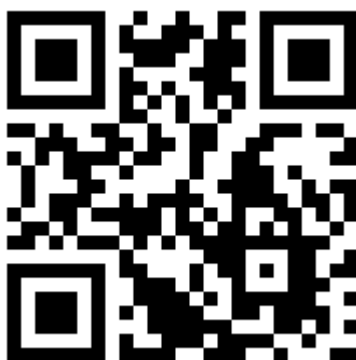
QR Code para download do aplicativo para sistema operacional Android

Clique aqui para fazer o download do aplicativo Congresso AR 2018 para iOS.