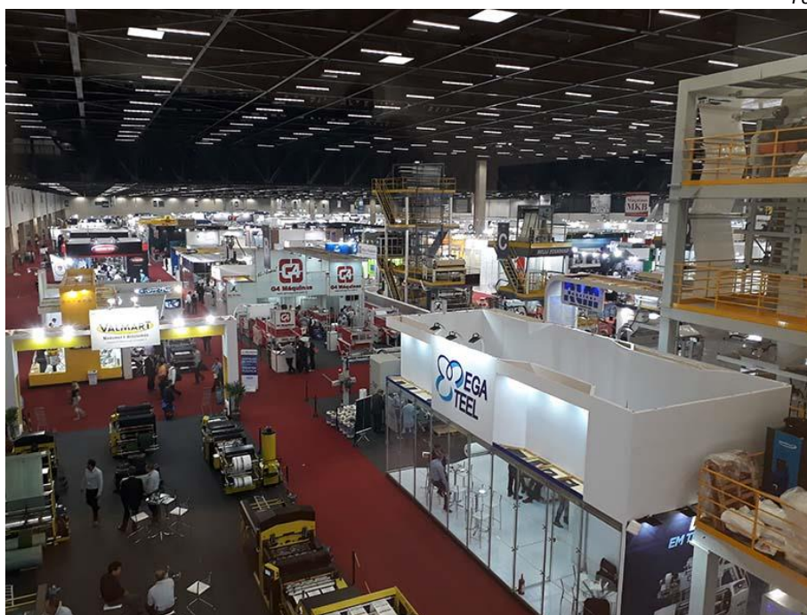
Vista geral da primeira edição da Plástico Brasil, realizada em 2017

A segunda edição da Plástico Brasil – Feira Internacional do Plástico e da Borracha acontece de 25 a 29 de março de 2019, no São Paulo Expo Exhibition e Convention Center, na capital paulista. As empresas que desejarem participar do evento, que deve receber cerca de 45 mil visitantes, já podem entrar em contato com a equipe comercial da Informa Exhibitions.