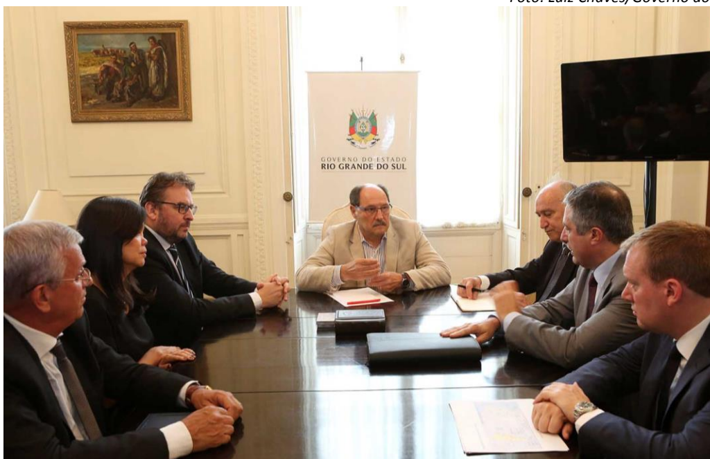
Governador do Rio Grande do Sul, José Ivo Sartori (ao centro), recebe representantes da indústria química para debater o fornecimento de gás natural.