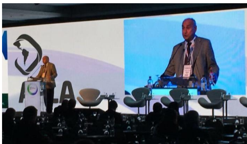
O presidente-executivo da Abiquim, Fernando Figueiredo

O presidente-executivo da Abiquim, Fernando Figueiredo, foi um dos palestrantes da seção plenária “Monetización de carbono: Oportunidad para una competitividad sostenible”, realizada no dia 14 de novembro. Figueiredo contou que apesar de ocupar a sexta posição na emissão de gases de efeito estufa (GEE), o Brasil reduziu em 39% suas emissões de 2005 a 2015, no mesmo período as emissões globais subiram 35%. O executivo explicou que o setor industrial brasileiro é responsável por 2,9% do total de emissões, sendo que, dentro destes 2,9%, a indústria química é responsável por 5% das emissões. Figueiredo explicou que o Brasil tem potencial para se tornar um líder mundial na economia de baixo carbono e que a indústria química é essencial para o desenvolvimento de tecnologias que possibilitem a redução das emissões.