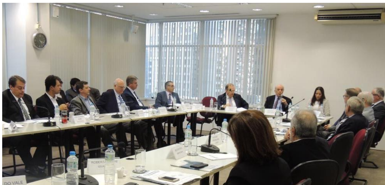
Reunião do Conselho Diretor da Abiquim, com a presença do Senador José Serra (PSDB/SP)

O senador José Serra (PSDB/SP) foi o convidado da reunião do Conselho Diretor da Abiquim, realizada no dia 26 de julho. Em sua apresentação, o parlamentar destacou a importância das reformas trabalhista e previdenciária, além de sua preocupação com relação ao grande risco aos já escassos planos de investimentos pela proposta da nova TLP, sobre a taxa de juros de longo prazo do BNDES.