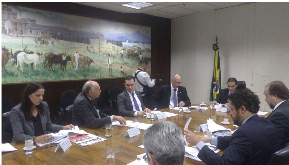
Integrantes da FPQuímica e Abiquim se reúnem com o ministro Marcos Pereira