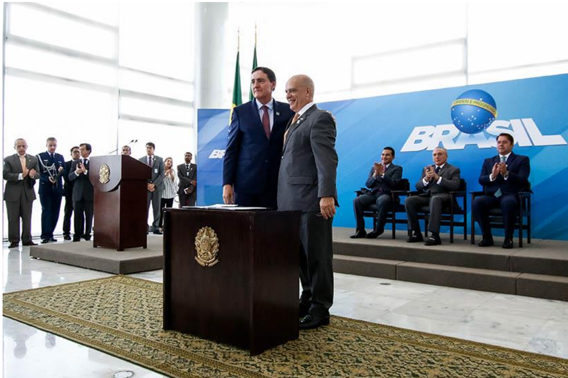
Diretor-Presidente da Anvisa, Jarbas Barbosa e o Presidente do INPI, Luiz Otávio Pimentel, durante assinatura de Portaria conjunta.

A Agência Nacional de Vigilância Sanitária (Anvisa) e o Instituto Nacional da Propriedade Industrial (INPI) assinaram na quarta-feira, 11 de março, uma portaria conjunta que agilizará o exame de patentes na área de produtos e processos farmacêuticos e facilitará a chegada de novos medicamentos genéricos ao mercado. Pelo acordo, a Anvisa analisará os pedidos, para anuência prévia, com foco no impacto à saúde pública, enquanto o INPI será o responsável por analisar os critérios de patenteabilidade.