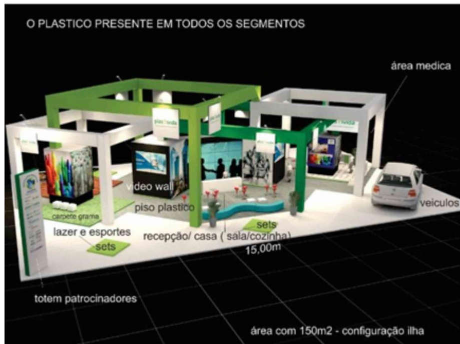
Perspectiva do estande da Recicla Plástico Brasil

A programação paralela da Plástico Brasil – Feira Internacional do Plástico e da Borracha, iniciativa da Abimaq e da Abiquim, contará com o projeto Recicla Plástico Brasil, promovido pela Plastivida, Instituto Brasileiro do PVC, Abimaq e Abiquim, com o objetivo de disseminar a educação ambiental em torno da reciclagem do plástico e sua reutilização bem como promover sua imagem.