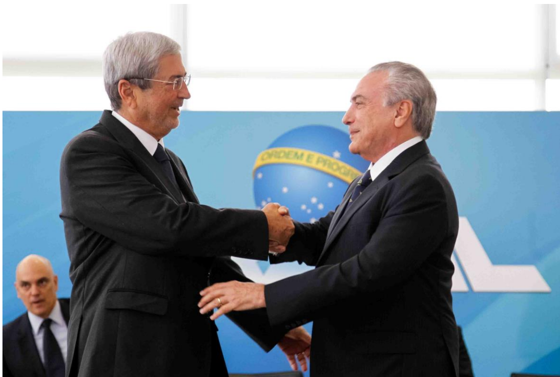
Presidente Michel Temer cumprimenta o novo Secretário de governo Antonio Imbassahy